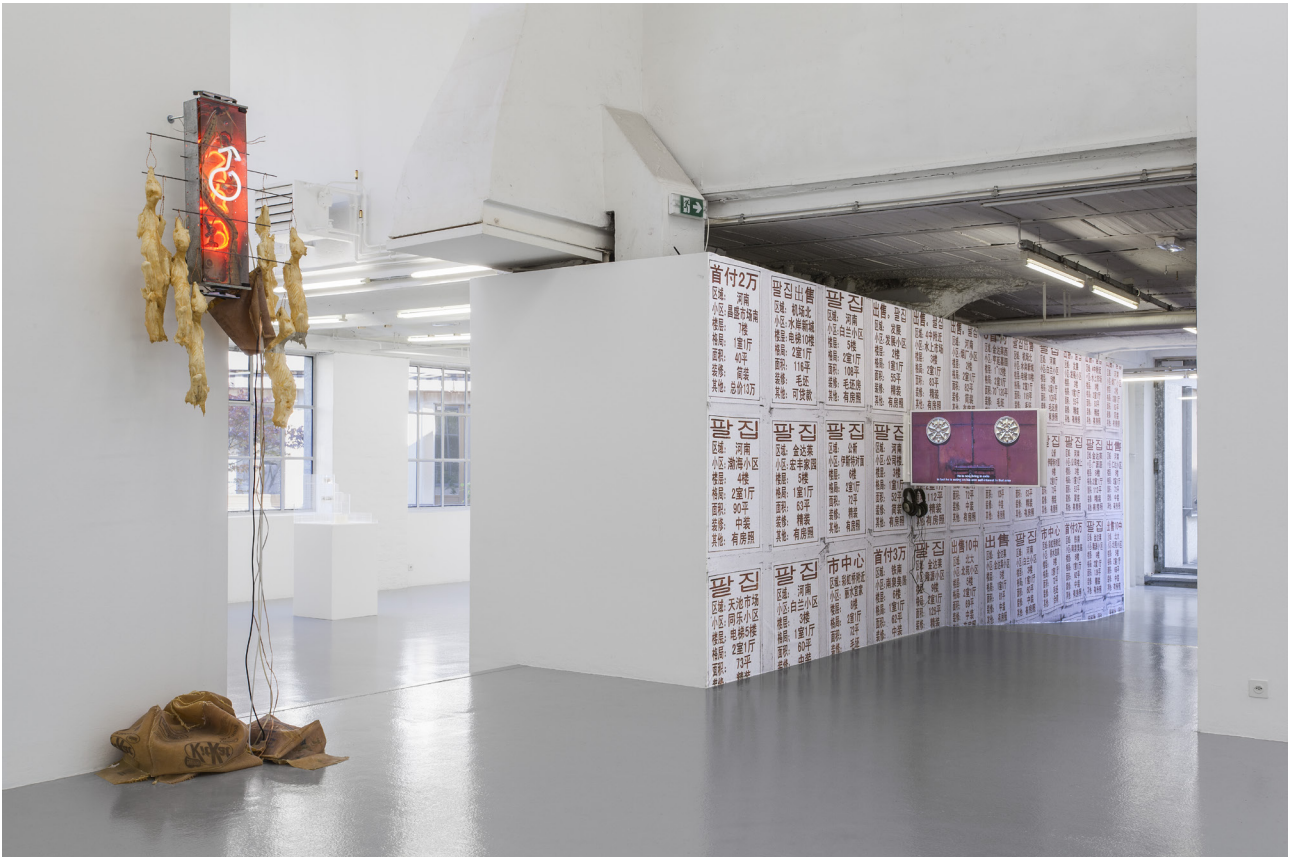
전시전경, Neo Geography I, CAN, 2017

지그프리트 기디온은 저서 <Building in France>에서 “바쁜, 현대” 독자를 위하여 캡션이 달린 사진 몽타주 형식으로 만든 “책”이 건축을 “전시”하는 가장 이상적 매개체라 말한 바 있다. <네오지오그래피 I>과 <네오지오그래피 II> 전시 후 프로젝트의 기획, 연구, 전시 내용과 기고문 (최초 번역문) 등으로 엮어진 엔솔로지를(국문 영문) 발간하여 책이라는 매개체를 통해 프로젝트를 다시 “전시”할 예정이다.