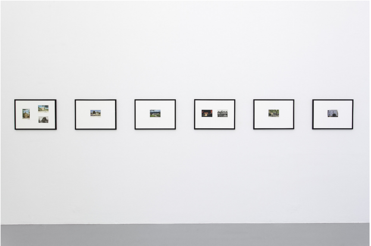
남화연, Dimitroff str. 35, 1058 Berlin, DDR, 2017. Neo Geography I, CAN