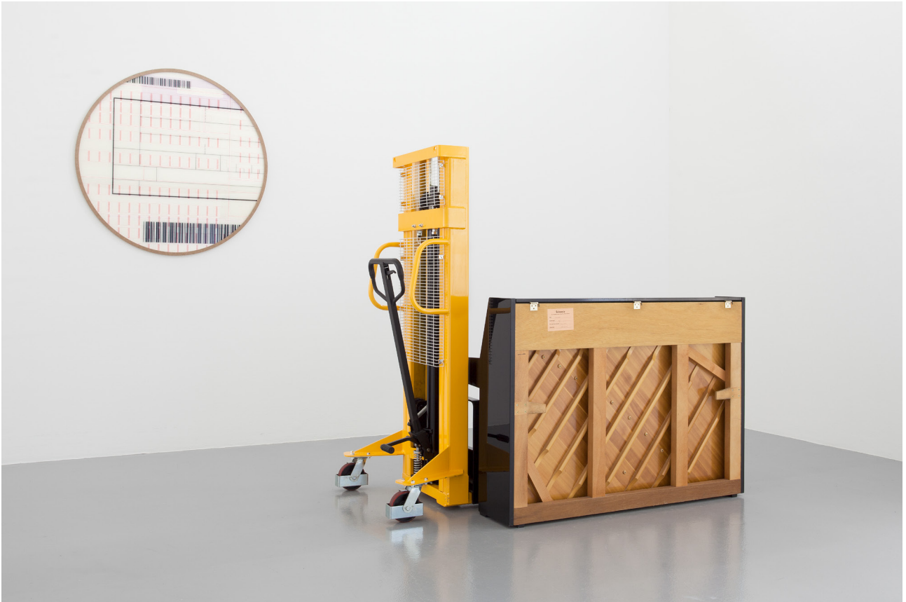
마티아스 조어, Bureaucracy Study #4 (왼쪽), Elevate (오른쪽), 2017. Neo Geography I , CAN