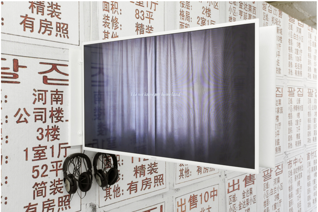
안유리, 설치 전경, Neo Geography I, CAN