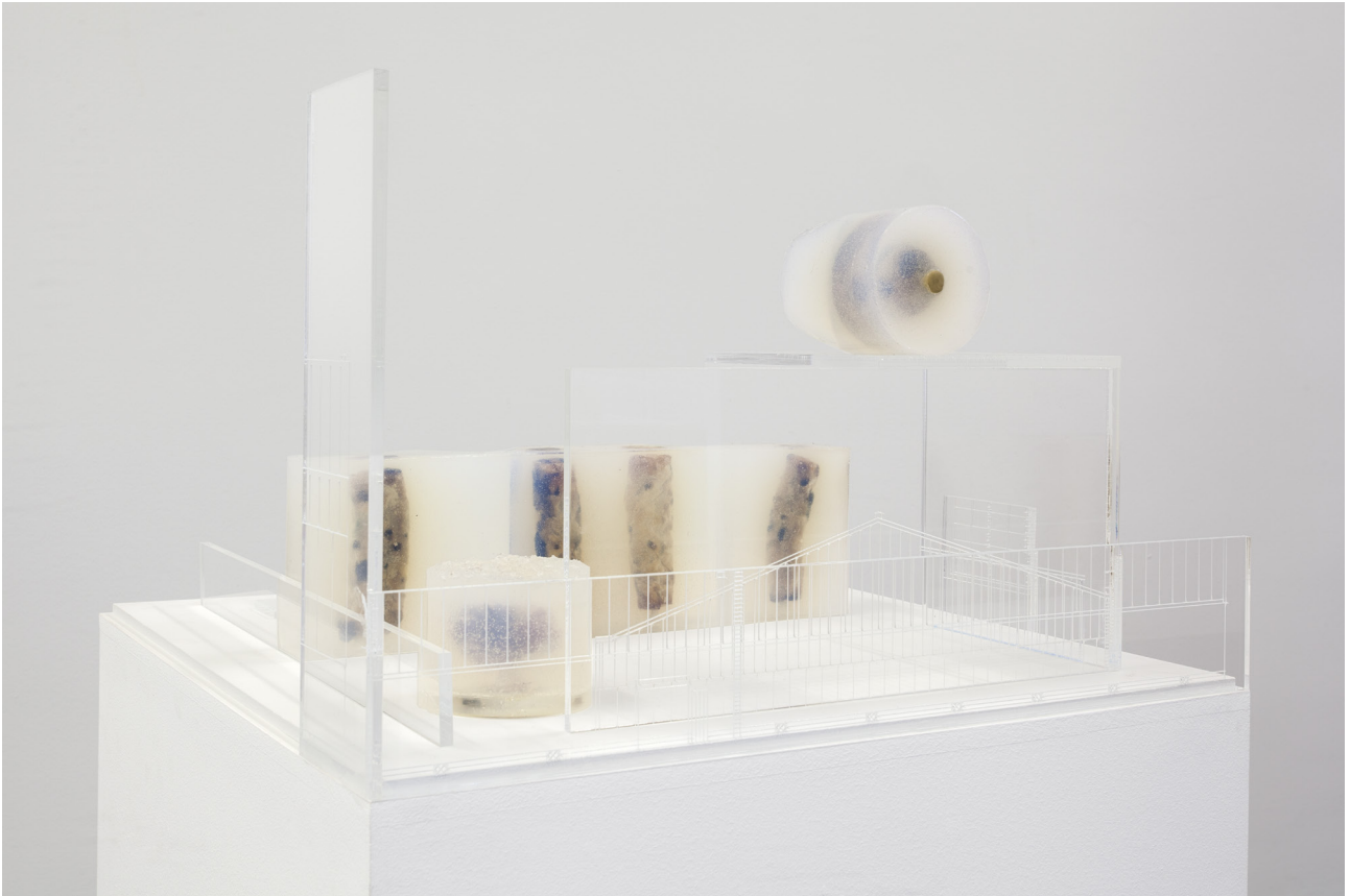
박지희, 1:1 x 1:99.475 / 5, 2017. Neo Geography I , CAN