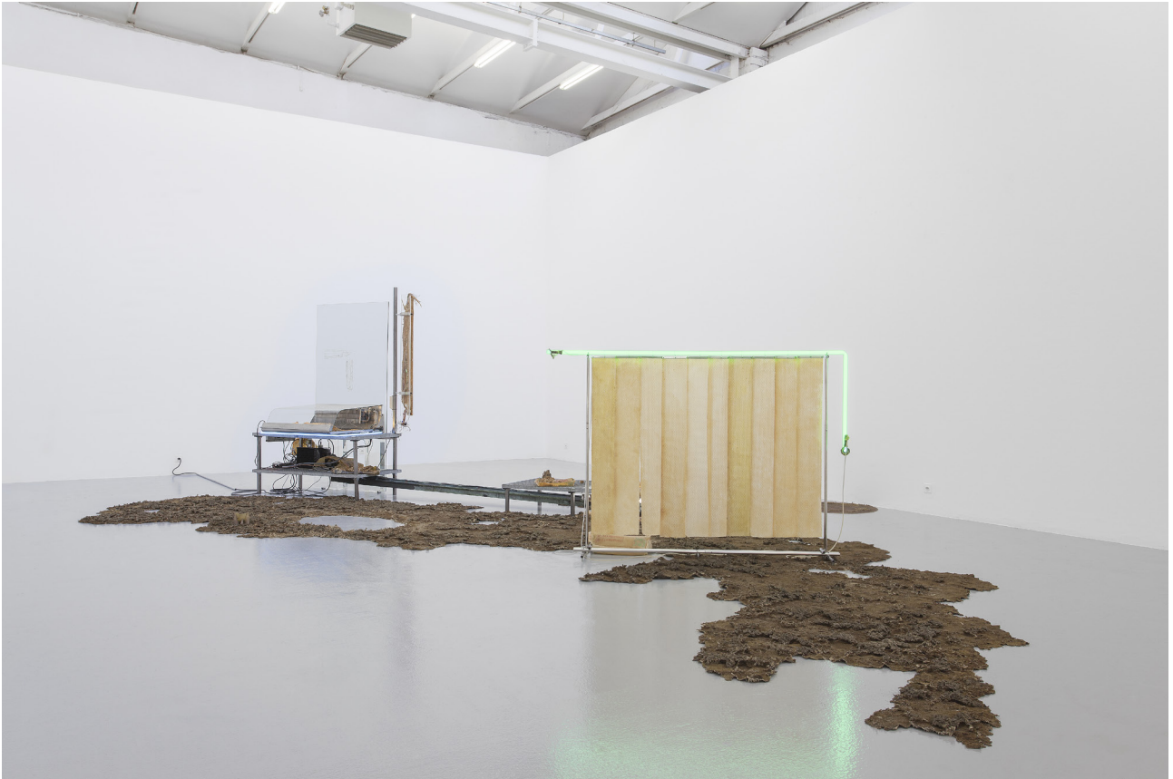
클로에 들라뤼, TAFAA - so o am, 2017. Neo Geography I, CAN